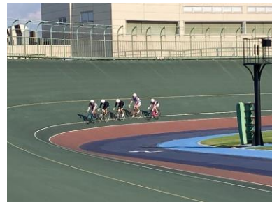
競輪選手練習をバンク内で観戦