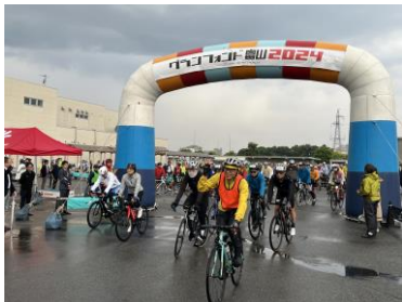
悪天候のためロングもミドルでスタート