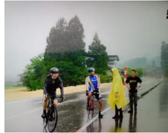
八尾エイドへ誘導