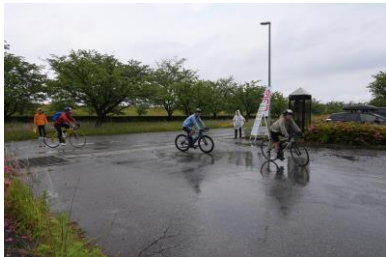
ラストのエイド常願寺へ