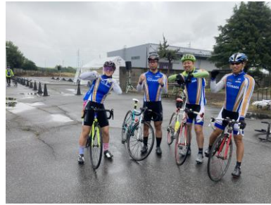
競輪選手も参加者と一緒に走るため待機