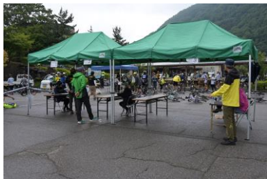
水記念エイドでナンバーチェック