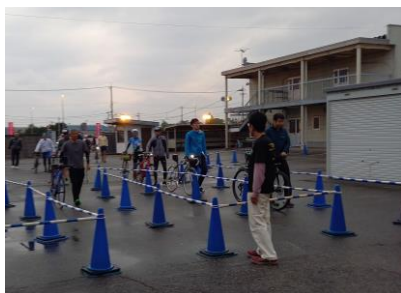
スタート前にライトチェックを受ける