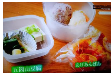
ロングコース メニュー