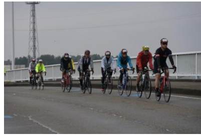
新湊付近コース走行