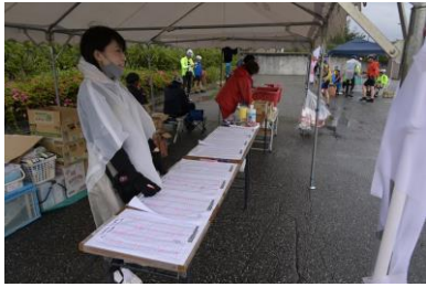
常願寺エイドでナンバーチェック