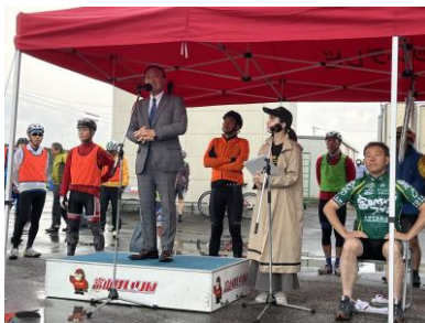
開会式 大会長あいさつ