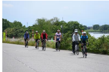
常願寺川コース走行