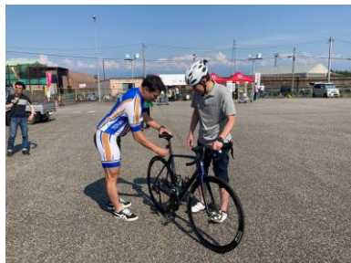
競輪選手ポジショニング指導