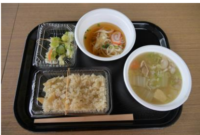
八尾エイド 好評おこわ・豚汁