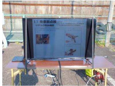
自転車安全活用講座動画