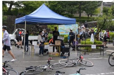
水記念エイドで休憩