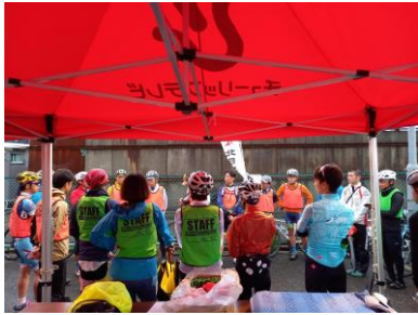
走行スタッフのスタート前最終会議