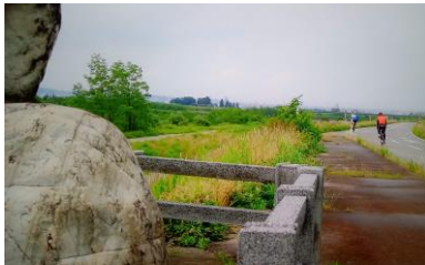
再びコース ゴール競輪場へ