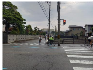
競輪場からミドルコースへ