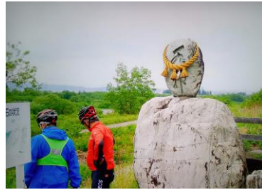
コースの途中で観光も