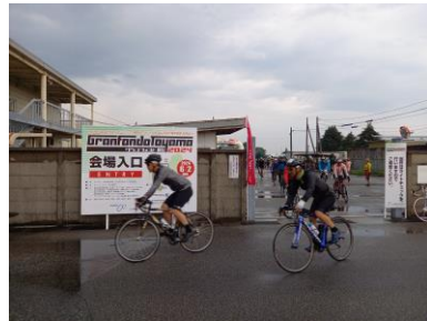
今年は悪天候のためロングもミドルへ