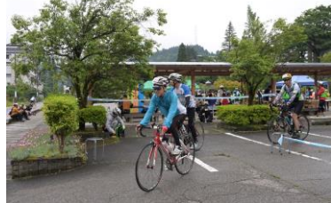
おなかも満たされて再びコースへ