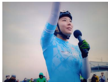
参加選手の交通安全宣言