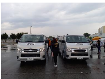
回収車・医療車もスタート準備