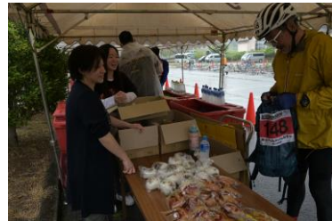
八尾エイドで昼食