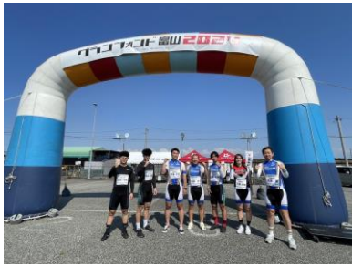
前日イベント競輪選手ふれあい企画 競輪選手もお手伝いしていただきました