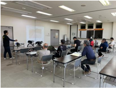
前日イベント自転車安全活用講座