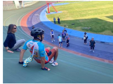
前日イベント競輪選手ふれあい企画 競輪選手練習をバンク内で観戦