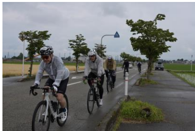
砺波付近麦畑を走行