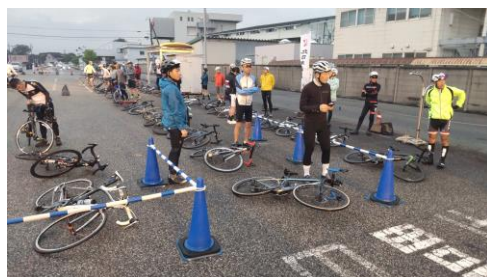
開場前の待機待ち