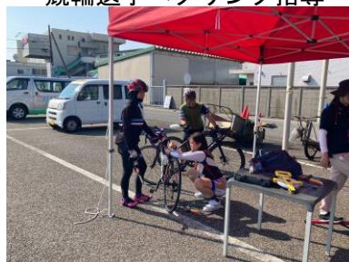
競輪選手ペダリング指導